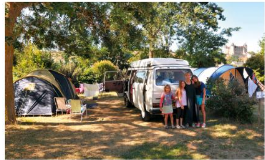
2 Un camping à Maupertus-sur-Mer (Manche)

Un autre type d'hébergement consiste à louer dans un hôtel une chambre meublée, où sont proposés des services comme le petit déjeuner et l'entretien des chambres. La France compte 1 200 000 lits pour 17 000 hôtels.