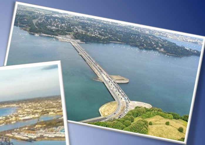
usine marémotrice de la Rance