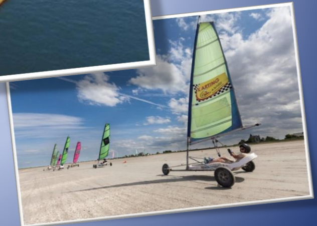
Char à voile sur le site d'Hirel