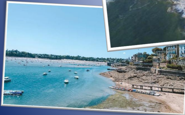
Randonnée guidée sur le littoral de la côte d'Emeraude