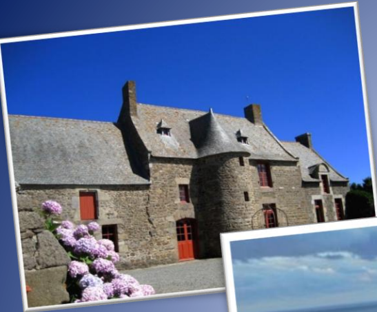
Manoir Jacques Cartier